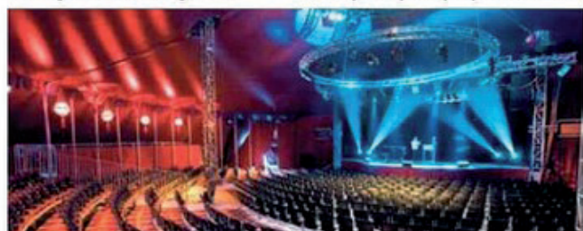
Depuis sa création il y a huit ans, le chapiteau Das Zelt a accueilli plus de 1,5 million de spectateurs.